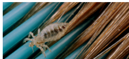
Hoofdluis op een kam.